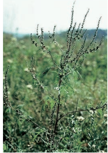
Figur 1. Beiskambrosia. Planten har mange bygningstrekk til felles med burrot.

som øvrige pollenallergier (2, 3, 4). Ved høye pollenfrekvenser kan en direkte kontakt med huden gi sinte dermatitter. Dette er uvanlig ved andre pollenallergier. Man finner også kryssallergier. Det er ikke uvanlig at en ragweed-allergiker kan kjenne kløe og hevelse i munnhule og svelg ved inntak av melon og banan.