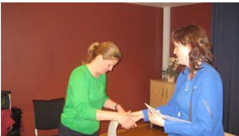
Alle deltakere fikk utdelt kursbevis som dokumentasjon for gjennomført inneklimakurs.